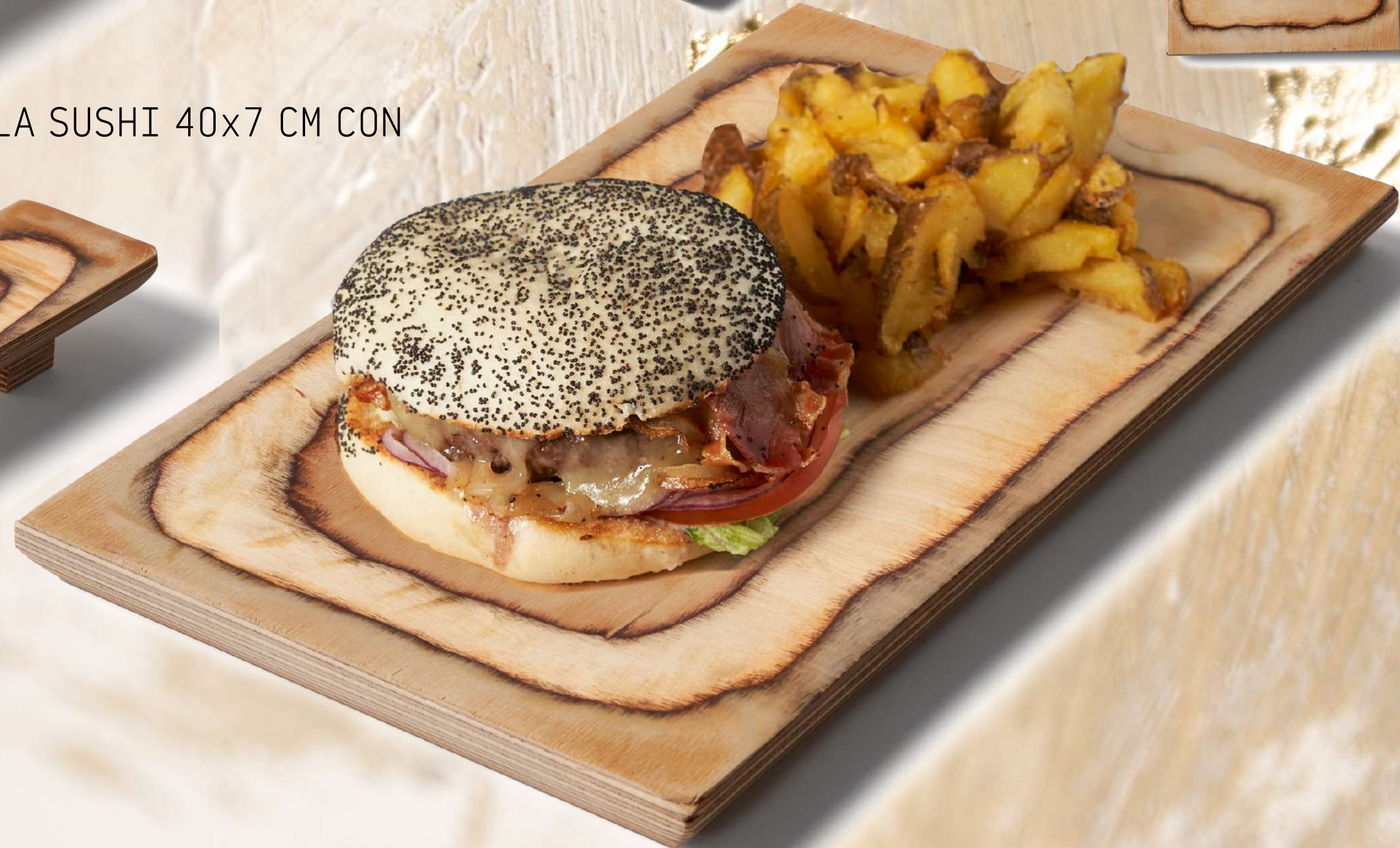
• TR3420 TABLA RECTANGULAR 34x20 CM.