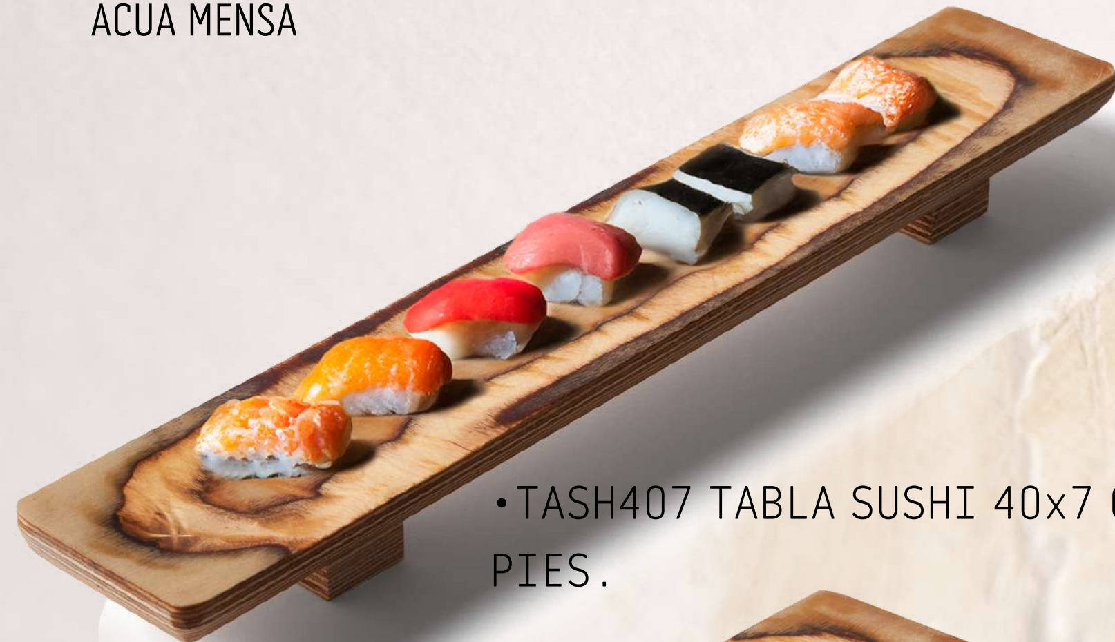
• TASH407 TABLA SUSHI 40x7 CM CON PIES.